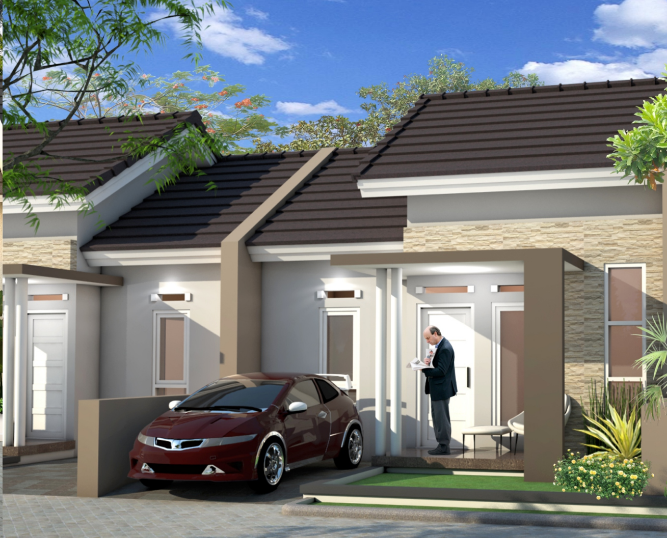
TYPE 40 TULIP