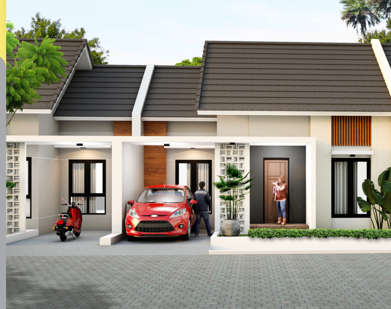
TYPE 60 ASTER