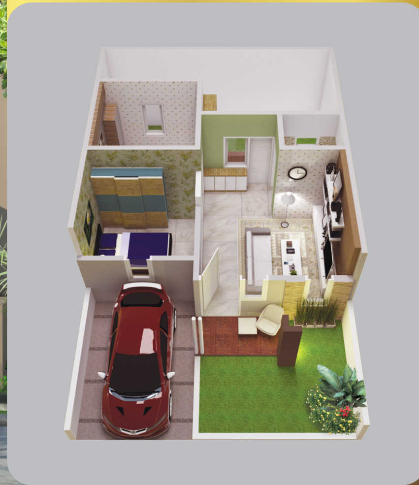
TYPE 40 NEW TULIP